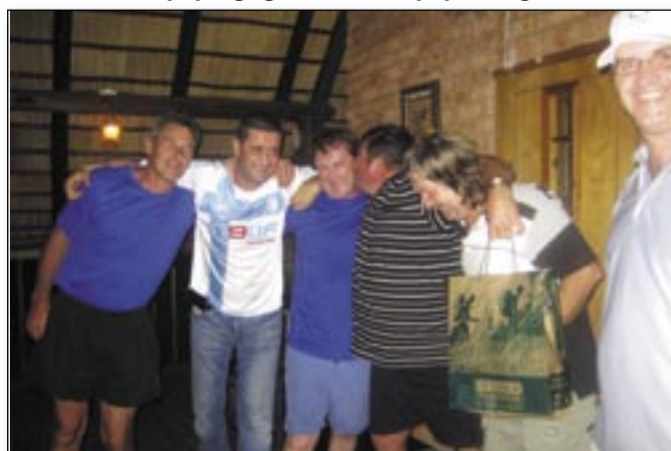
3rd – The Blue Team 3eme – L'équipe en bleu