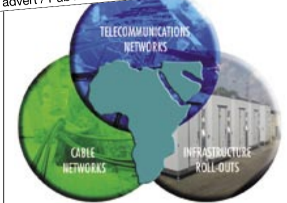
Caption / Words / pics Sous titres / mots / photos