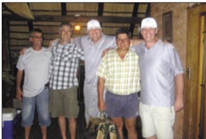
Winning Team – The Grey Team L'équipe gagnante – L'équipe en gris

Teams receiving their prizes Remise des prix par équipe