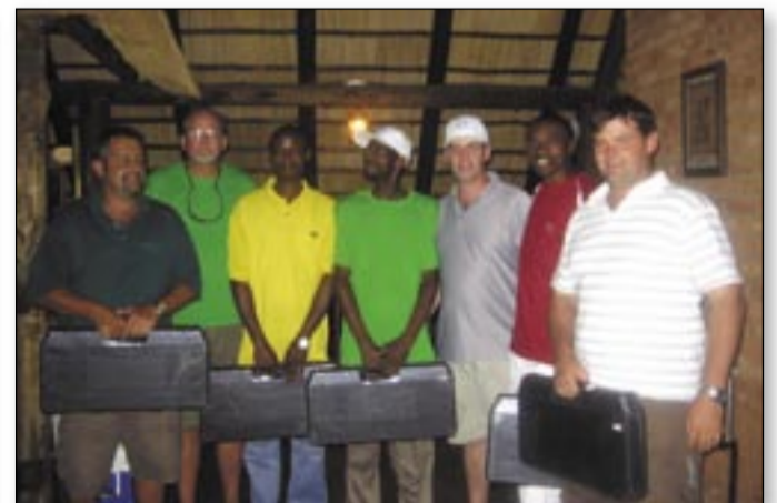
Runners up – The Green Team Second en titre – L'équipe en vert

Un compte rendu le matin suivant finalisa l'événement et nous repartîmes à nos différents postes Africains afin de commencer une nouvelle année pleine de succès!