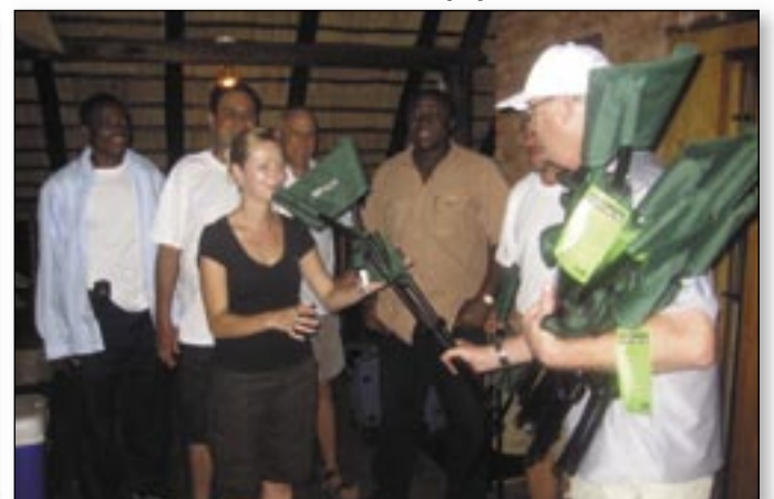
4th – The White Team 4eme – L'équipe en blanc