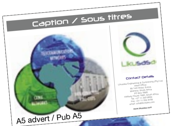
A5 advert / Pub A5